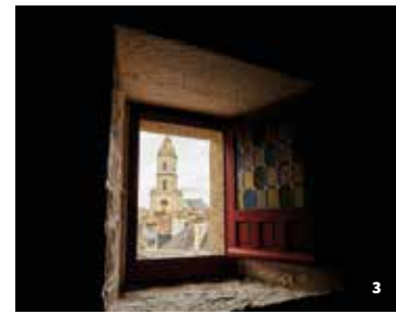
1. Vannes, la ville ancienne