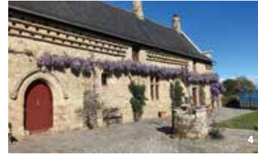
4. Manoir de Kérat, Arradon