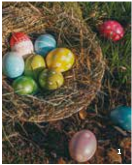
1. Fêtez Pâques en famille à Limur !