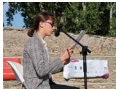
et lecture de «La reine des coquillages», de Nathalie et Yves-Marie Clément par Nikita Pagnier Rollin