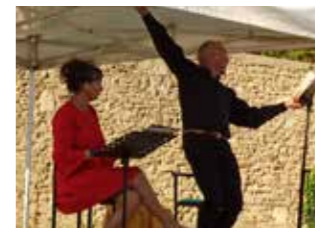
«Écrits d'Amour» le 13 août