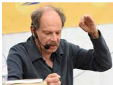
Denis Podalydes, lecture d'extraits de «Briques et tuiles» de Victor Segalen