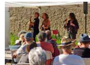
Trio la Quinte le 16 juillet

Tous ces spectacles en appellent d'autres. Aussi, nous vous donnons rendez-vous en 2022 pour un Ton bourg battant survitaminé et des spectacles qui s'enchaîneront, en centre bourg et sous le grand chapiteau bleu du Verger de l'abbaye.