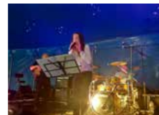
La Wild Family le 7 août dans le cadre du festival Ton Bourg Battant

Le Verger de l'abbaye a également accueilli « Ton bourg battant » cet été. Dans l'obligation du contrôle du pass sanitaire, le festival a en effet dû s'adapter et se déplacer sous un chapiteau de cirque. Ainsi, début août, sept soirées de spectacle vivant ont été organisées en mettant l'accent sur le « tribute », entendez par là des hommages à des groupes rock de renom (Rolling Stones, U2, Pink Floyd).