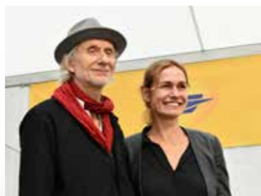
Erik Truffaz et Sandrine Bonnaire, lecture musicale de «Carnets» de Goliarda Sapienza