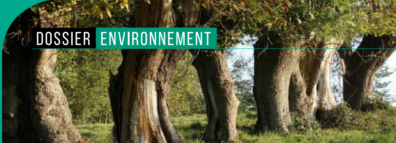
Arbres têtard