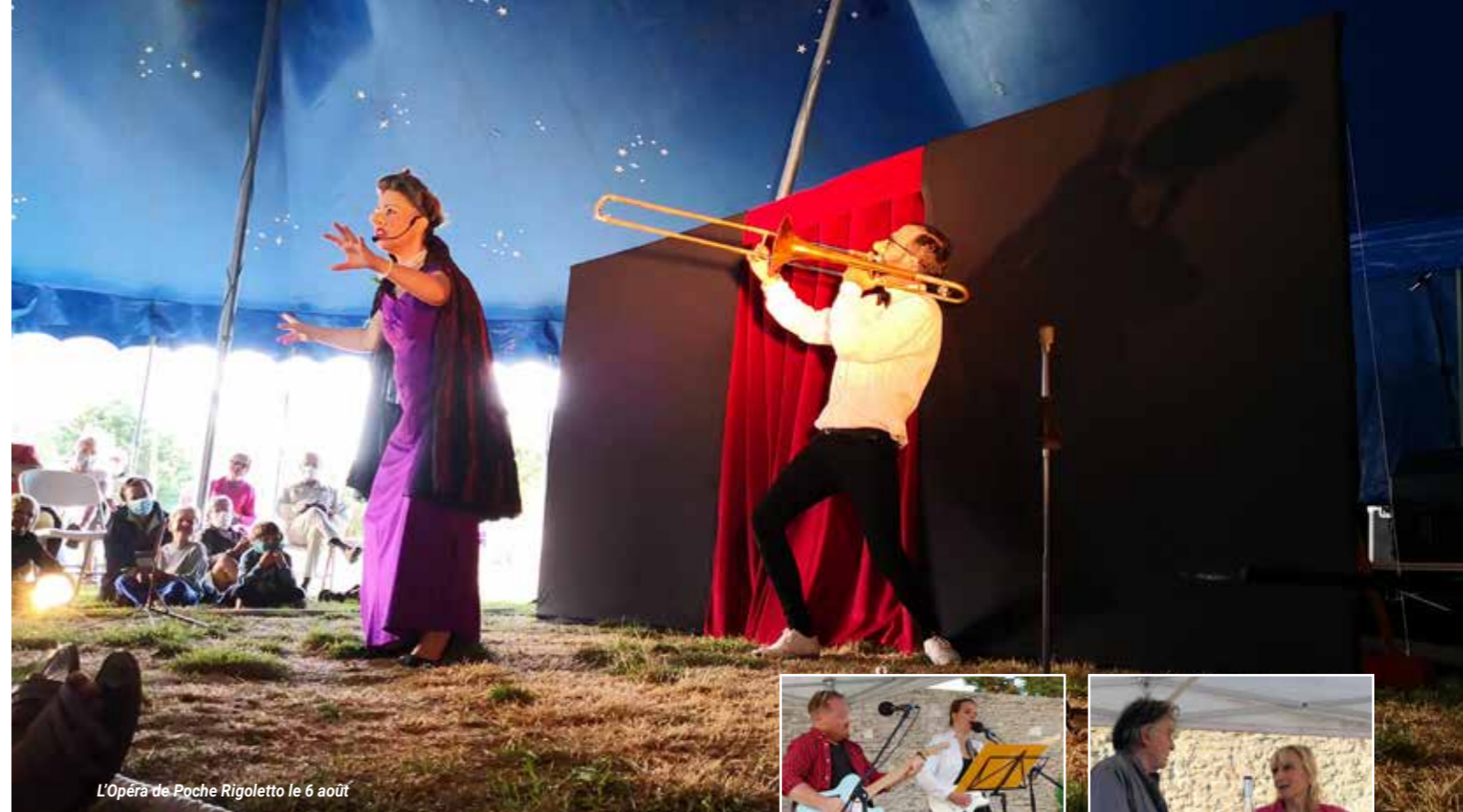
L'Opéra de Poche Rigoletto le 6 août