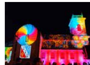
Son et lumière les 27 juillet et 17 août