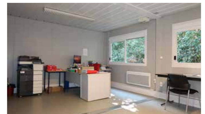
Les travaux avancent !