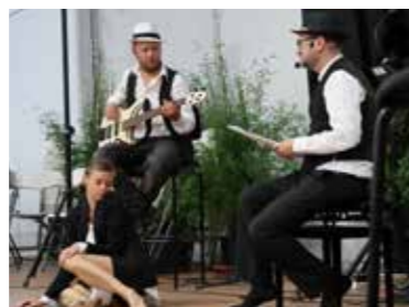
Spectacle du Conservatoire de l'Hermine «Identités la mienne la tienna la nôtre»