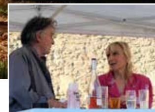
Les Z Artmateurs le 27 août